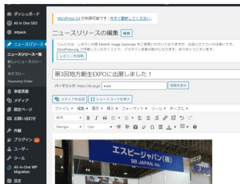
新規投稿画面 イメージ