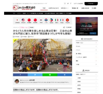
記事公開 イメージ