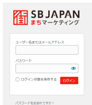
ログイン画面 イメージ