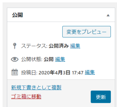
記事申請画面 イメージ